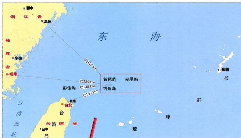
钓鱼岛及其附属岛屿位置示意图