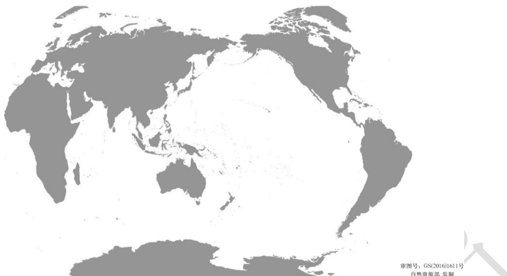
图 2 世界地图